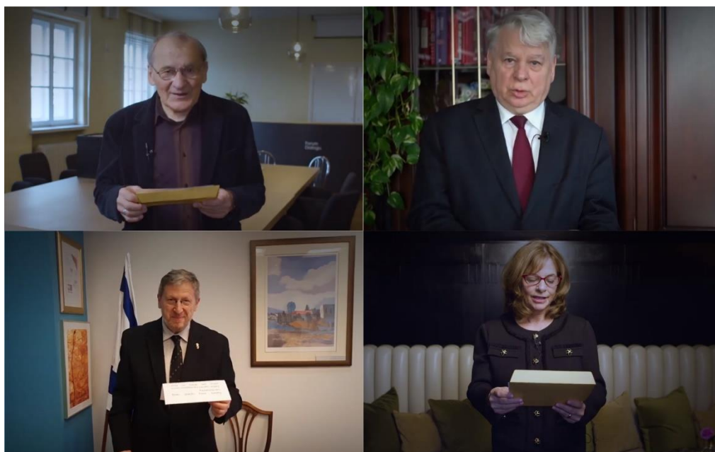
Mówcy podczas Gali Online Szkoły Dialogu 2019.

Forum Dialogu już od 12 lat wspiera uczniów szkół podstawowych i ponadpodstawowych w poszukiwaniu osobistych losów dawnych członków ich społeczności lokalnej. Grupy projektowe uczestniczące w programie Szkoła Dialogu odkrywają często zapomnianą historię i kulturę żydowską w swojej miejscowości, a następnie poprzez różnorodne działania prezentują zdobytą wiedzę innym mieszkańcom. W związku z zagrożeniem epidemiologicznym chorobą COVID-2019 tegoroczne uroczyste podsumowanie kolejnej edycji programu, a zarazem uhonorowanie uczestników i uczestniczek oraz podziękowanie za ich ciężką pracę, odbyło się online 17 kwietnia 2020 roku.